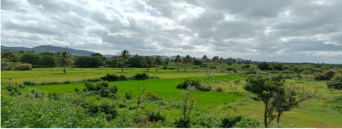
ಒತ್ತುವರಿಯಾದ ಕೆರೆಯ ಸರ್ವೆಕ್ಷನ್ ಮಾಡಿ ಕೆರೆಯ ಜಾಗ ಗುರ್ತಿಸಿದ ಉಪವಿಭಾಗಾಧಿಕಾರಿಗಳ