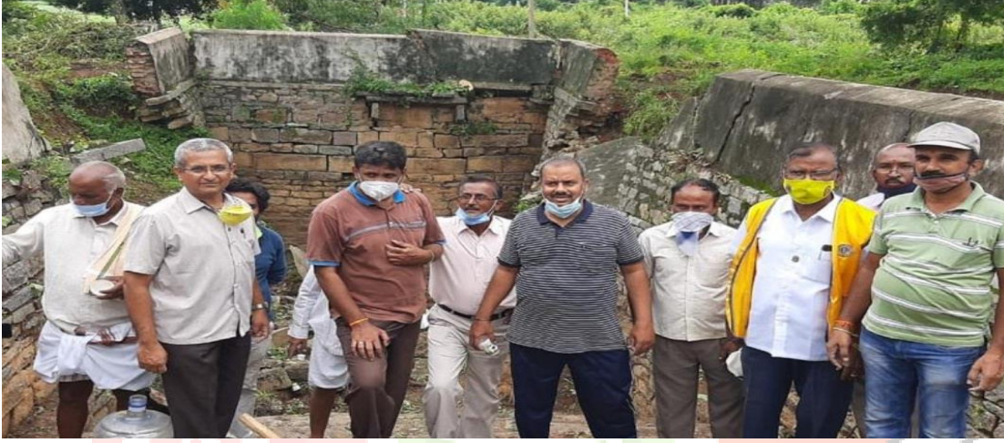
ಕಲ್ಯಾಣಿಯ ತಳ ಭಾಗ ಸ್ವಚ್ಛಗೊಳಿಸುತ್ತಿರುವ ಸೇವಾ ಪ್ರತಿಷ್ಠಾನದವರು, ಗ್ರಾಮಸ್ಥರು