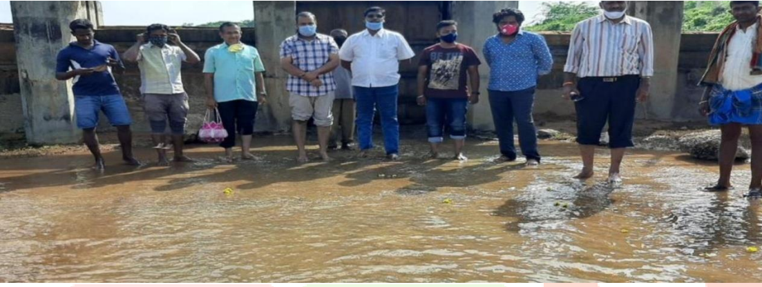
ಕೆರೆಯ ಪುನರುಜ್ಜೀವನಕ್ಕೆ ಮೊಟ್ಟಮೊದಲು ದೇಣಿಗೆ ನೀಡುತ್ತಿರುವ ಸಹೃದಯ ಹಿರಿಯ ಜೀವ