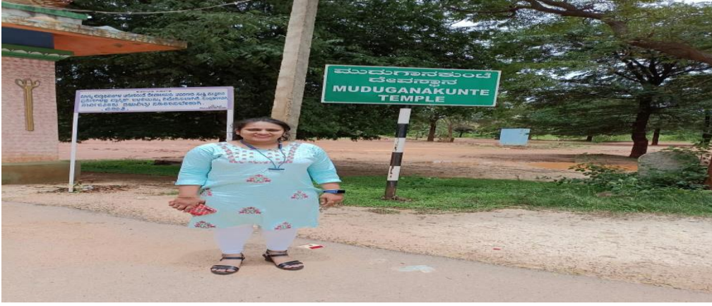
ಕೆರೆಯ ಊಳು ಎತ್ತಿದ ಮಣ್ಣನ್ನು ಬಳಸಿ ಸಮೃದ್ಧವಾಗಿ ಬೆಳೆದು ನಿಂತಿರುವ ಬೆಳೆ