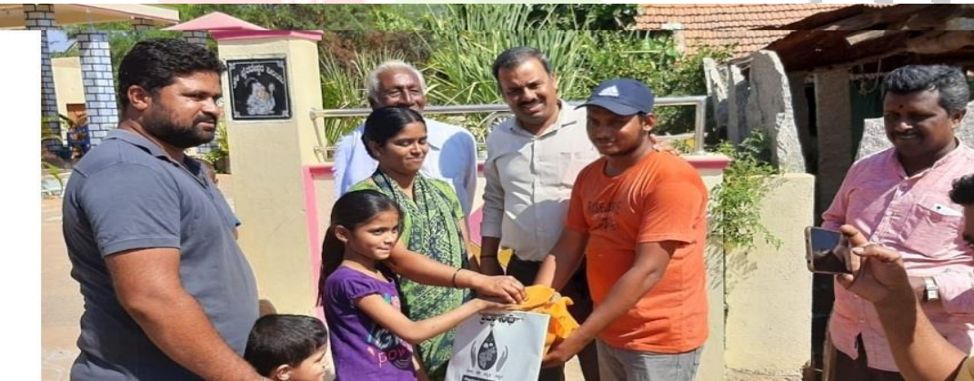
ಗ್ರಾಮಸ್ಥರು ಕೆರೆಯ ಕಾರ್ಯಕ್ಕೆ ದೇಣಿಗೆ ನೀಡುತ್ತಿರುವುದು