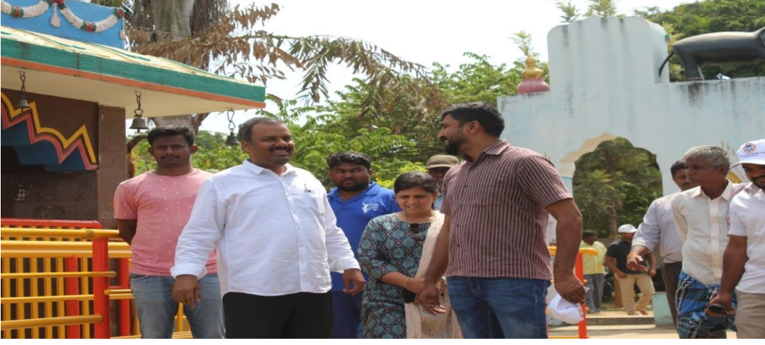
ಕಲ್ಯಾಣಿ ಸ್ವಚ್ಛತಾ ಕಾರ್ಯದಲ್ಲಿ ತೊಡಗಿರುವ ಗ್ರಾಮಸ್ಥರು, ಸೇವಾ ಪ್ರತಿಷ್ಠಾನದವರು