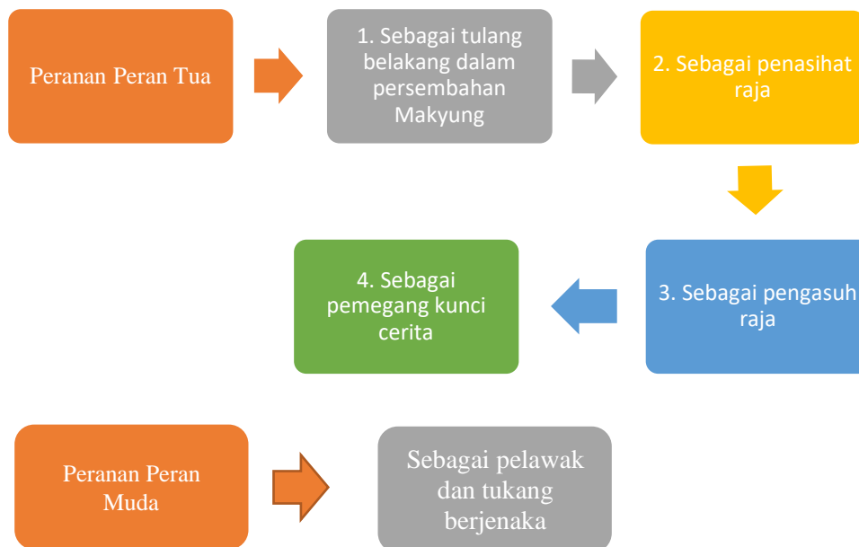
Rajah 1: Peranan Peran dalam Teater Tradisional Makyung