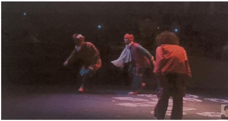
Gambar 2: Aksi Peran Muda meniru gaya berjalan Wak Nujum

Selain itu juga, pergerakan yang menunjukkan watak Peran melakukan pergerakan slapstik ialah ketika Peran Tua bersepakat dengan Peran Muda untuk meminta wang daripada raja dimana Peran Muda telah melakukan aksi seperti seseorang yang telah meninggal dunia iaitu jenazah yang boleh berjalan masuk ke dalam istana raja.